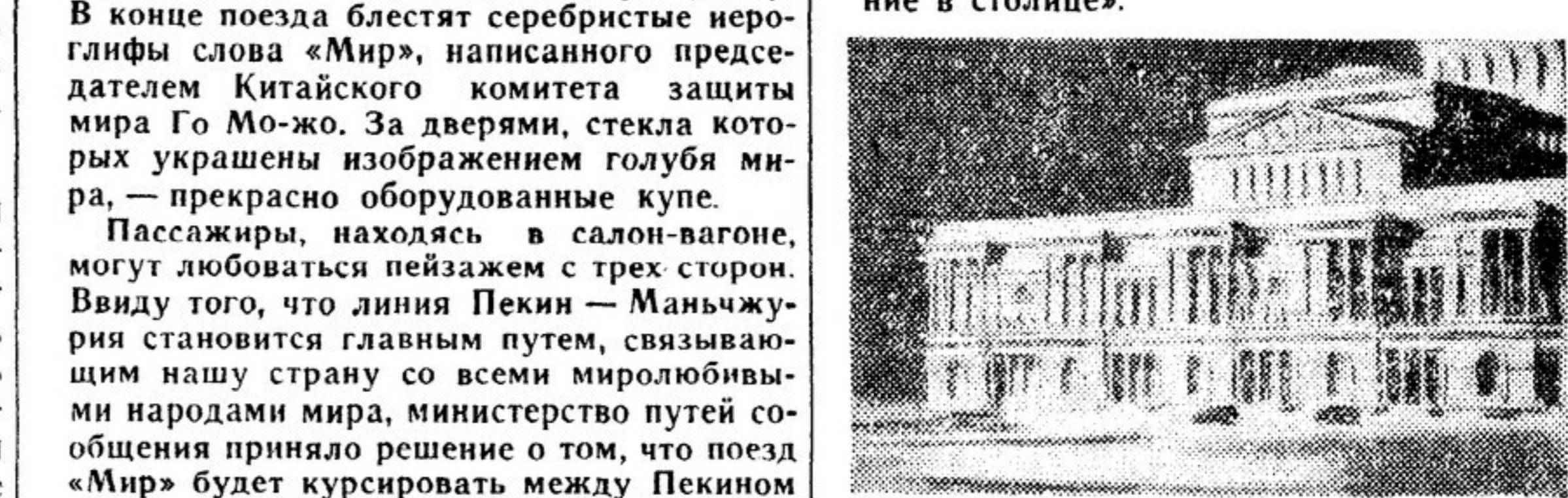
Макет здания Большого театра оперы и балета в Варшаве.

объекта нашей шестилетки, — предприятия громадных масштабов. Кубатура театре вместе со всеми прилегающими к нему помещениями — складами, залами для репетиций, оперной студии, балетной школы, нового крыла Национального театра, гостиных для артистов, театрального музея и др. — достигнет 455 тысяч кубических метров. Это будет второе по величине, после Дворца культуры и науки, здание в столице.